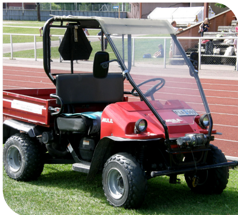
En fyrhjuling som motorredskap.