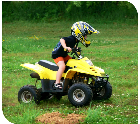
Räknas inte som lekfordon.

En vårdnadshavare eller annan vuxen som tillåter ett barn att köra fyrhjuling kan dömas för tillåtande av olovlig körning. Straffet för den vuxne är dagsböter. Det kan också medföra konsekvenser för körkortet. Även barnets framtida möjligheter att få körkortstillstånd påverkas. Om barnet fyllt 15 år kan det dessutom dömas till dagsböter för olovlig körning.